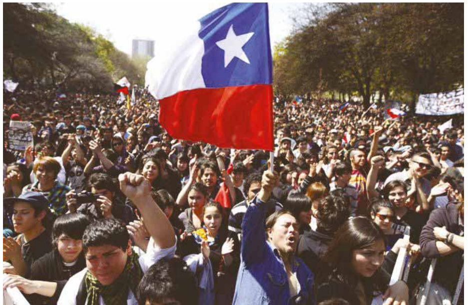
Studentendemonstrationen für bessere Bildungschancen in Chile

ESCO empfohlenen 7 Prozent. Über zwei Drittel aller chilenischen Studenten müssen Kredite aufnehmen, fast zwei Drittel der untersten Einkommensgruppen brechen ihr Studium aus wirtschaftlichen Gründen ab. Am 15. Oktober gingen wieder Zehntausende auf die Straßen der Hauptstadt, neben Schülern und Studenten auch viele Familien und Rentner, auch mit Forderungen nach neuen Umweltgesetzen oder nach der Abschaffung der Verfassung aus der