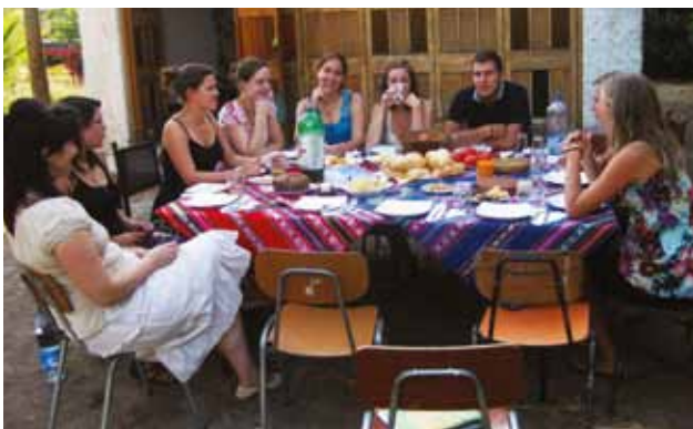
Freiwilligentreffen in Santiago de Chile

ren stets mit einem Lächeln und freundlichen Worten. Dabei ist ein begrüßendes „Wie geht’s?“ nicht nur Tradition, sondern gibt auch eine einfache Möglichkeit, in das Gespräch einzusteigen. Nach dieser kurzen Kennenlernphase ist man dann schon der neue „amigo“ und vollständig in die Gemeinschaft integriert, wird von den fürsorglichen Chilenen stets eingeladen und gut umsorgt. Ein weiteres Merkmal der lateinamerikanischen Freundschaften ist der häufige Körperkontakt, die Bereitschaft sein Eigenes immer und selbstverständlich zu teilen (z.B. die Getränke in der Mittagspause, eine Unterkunft bei häuslichen Problemen) und die damit verbundene herzliche Dankbarkeit. Die Chilenen sind stets auf das Positive konzentriert, es wird betont wie